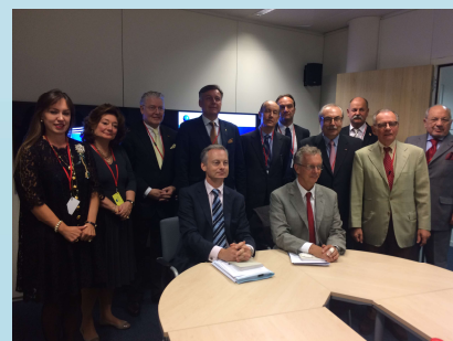
Délégation de la FUECH à l'UE Bruxelles