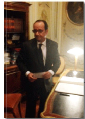
Le Président François Hollande