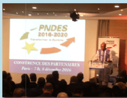
Le Président Kaboré à la Conférence sur le PNDES Paris