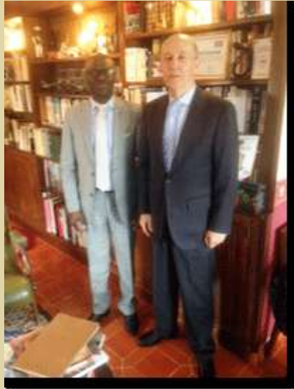
L'Ambassadeur et le Consul