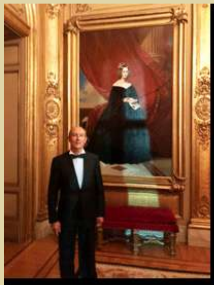
Le Consul de Nice au Palais d'Egmont