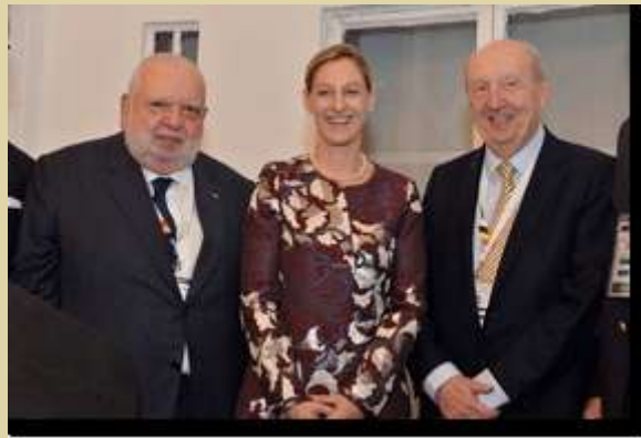
FICAC - BCU - Beaux-Arts : l'Ambassadeur d'Autriche, le président de la FICAC, le président de la BCU.