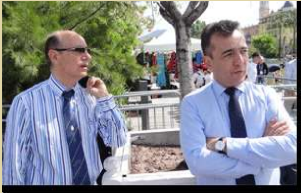
M. X. Lapeyre de Cabanes, le Consul