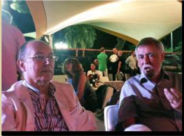
Les Consuls du Burkina et de Roumanie