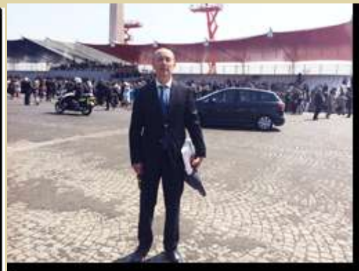
Place de la Concorde