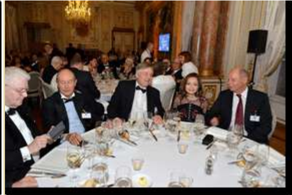
FICAC - BCU - gala dinner: Consul de Lituanie Vienne, le Consul du Burkina Faso à Nice, le président de la FUECH, le président honoraire du Corps Consulaire allemand, le président du Corps Consulaire de Roumanie.

À droite : FICAC Bruxelles, Centre Bozar