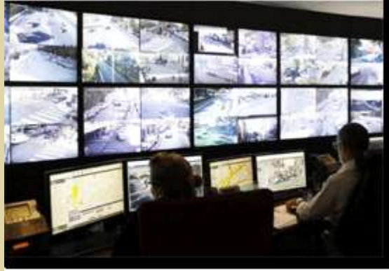
Le Centre de Supervision Urbain