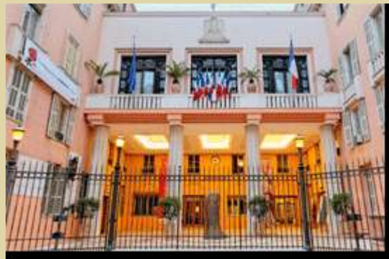
L'hôtel de ville de Nice

- 13 avril : Accueil de M l'Ambassadeur au Consulat du Burkina.