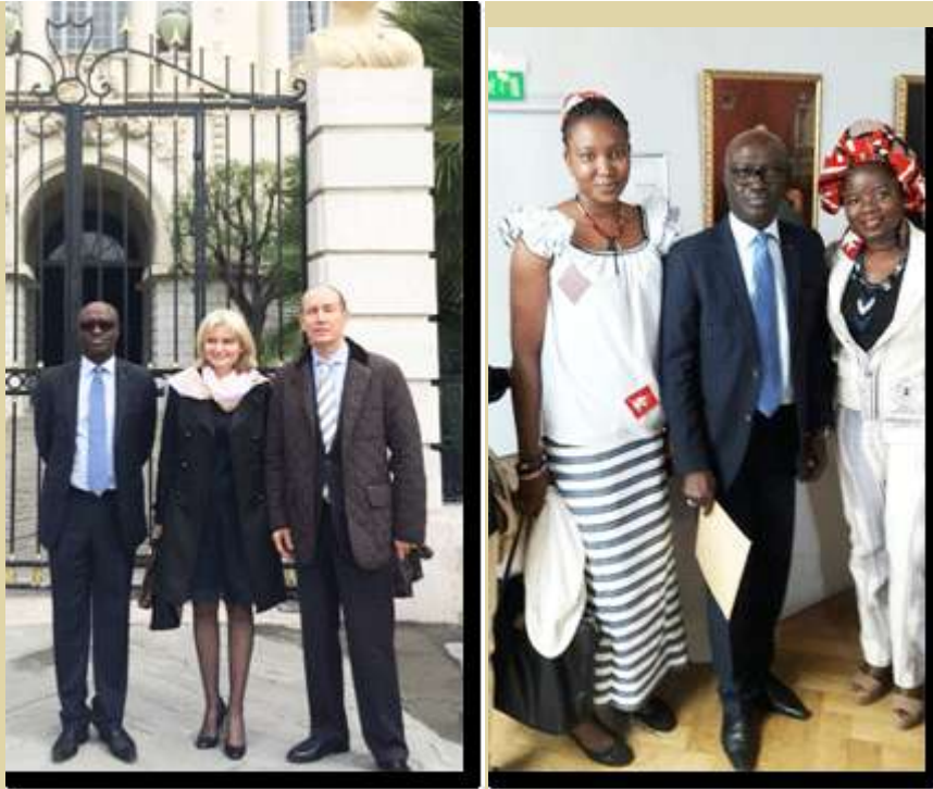
S.E l'Ambassadeur, le Consul et son épouse devant le CUM l'Ambassadeur et des ressortissants burkinabè