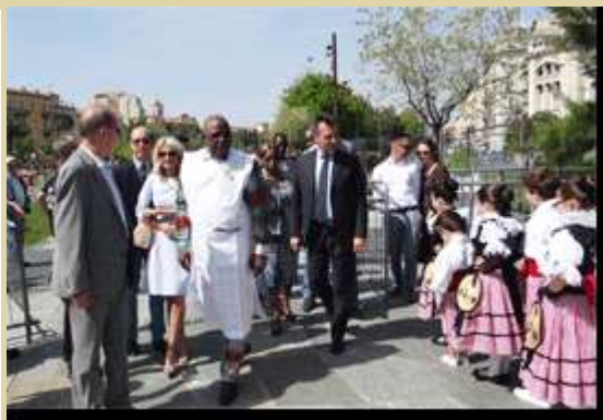
La délégation, l'Ambassadeur de France, le Consul