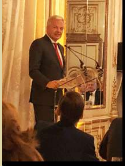
FICAC- Didier Reynders