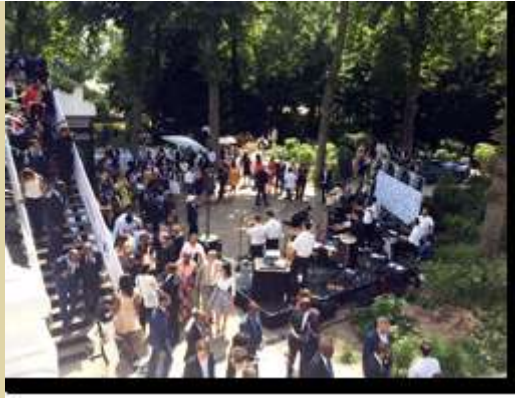
Le Consul s'est rendu à la Diplomatic Garden Party, au Pavillon Royal au Bois de Boulogne