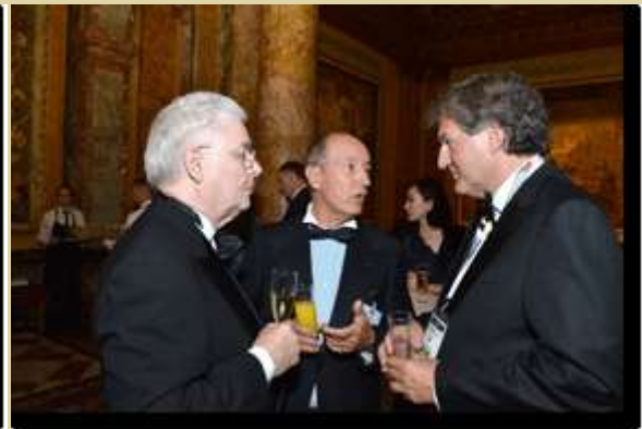
Centre Bozar à Bruxelles. Le Président Eken de la FICAC - à droite le Consul de Nice - à droite FICAC - BCU, gala dinner : Le Consul de Nice, le Consul de Lituanie Vienne