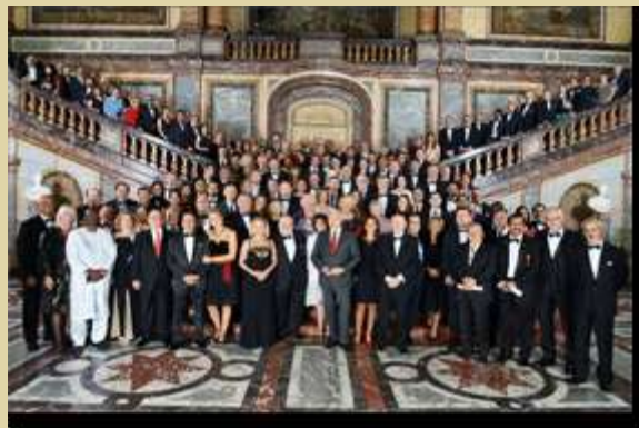
Palais d'Egmont, Bruxelles, dîner de gala, photo de groupe

À droite : FICAC Bruxelles, Centre Bozar