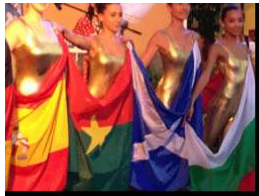
Soirée des villes jumelles à Grasse avec le Consul du Burkina Faso et madame, le Sénateur-Maire de Grasse Jean-Pierre Leleux et le maire de Legmoine Dari Somé. A droite : le défilé des villes jumelles