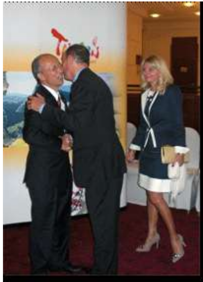
Fête nationale de la République de Chine à Paris L'Ambassadeur Michel Lu, le Consul de Nice et madame