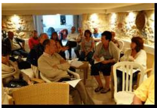
L'assemblée générale des Amis du Consulat