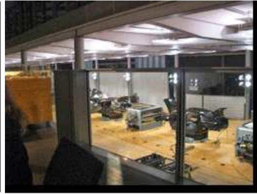
Le consul devant une phaeton, à droite, l'usine de Verre

- 2 novembre ; Réception au Parlement du Land de Saxe, par le Président Röbler