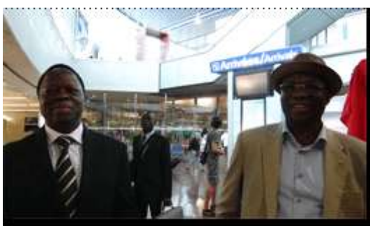
Accueil du Premier Ministre à l'aéroport de Nice Le Consul de Nice, l'Ambassadeur à Paris