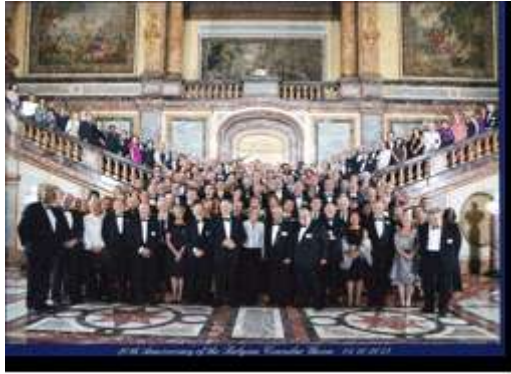
Palais d'Egmont à Bruxelles XXème anniversaire du Corps Consulaire

M. Didier Reynders, Vice Premier Ministre et Ministre des Affaires Etrangères belge a pris la parole à cette occasion, afin de féliciter les Consuls pour leur action et a décoré le doyen au nom du Roi.