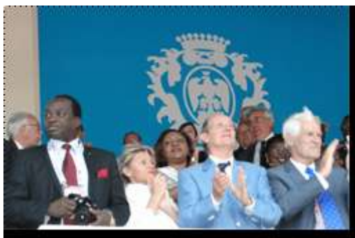
Clôture des Jeux de la Francophonie Le Ministre des Sports, le Consul et madame