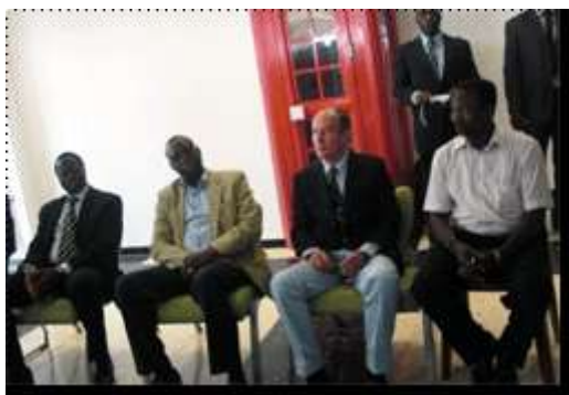
Réunion avec les sportifs et artistes burkinabè L'Ambassadeur, le Premier Ministre, le Consul de Nice, le Président des Burkinabè de Nice