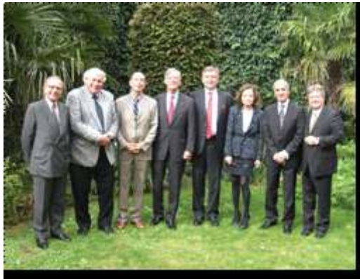
Réunion de la FUECH à Bruxelles avec les représentants des Corps Consulaires Européens