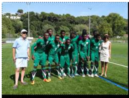
Les Etalons Juniors au stade de Villeneuve-Loubet Le Consul et madame