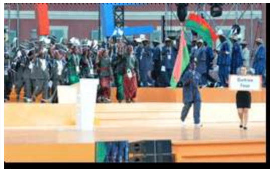
Place Masséna (Nice) : Le consul Général, Le Consul de Nice et sa fille, le Premier Ministre et l'Ambassadeur du Burkina Faso à Paris - Le défilé de la délégation du Burkina Faso