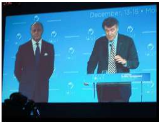
Mrs Laurent Fabius et Thierry de Montbrial

Dîner de gala avec Mr Laurent Fabius, Ministre des Affaires Etrangères français, en présence de Mr Didier Reynders, Ministre belge des Affaires Etrangères et de son homologue néerlandais.