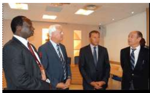
Réception de la délégation à la mairie de Villeneuve-Loubet