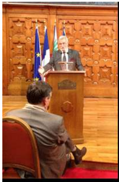
Le Consul de Nice avec le Consul de Roumanie