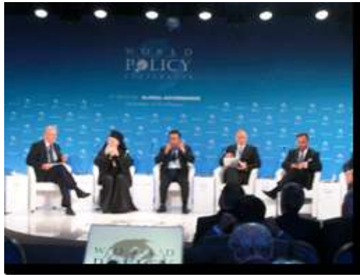
SAS Albert II de Monaco, Bartholomée 1er, Archevêque de Constantinople