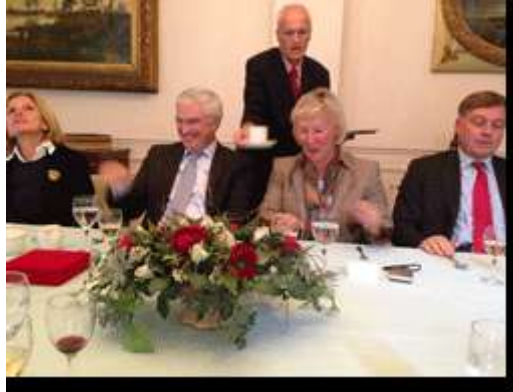
Le Consul avec les représentants des Corps Consulaires Européens Déjeuner au Palais du Gouverneur de Flandre Occidentale