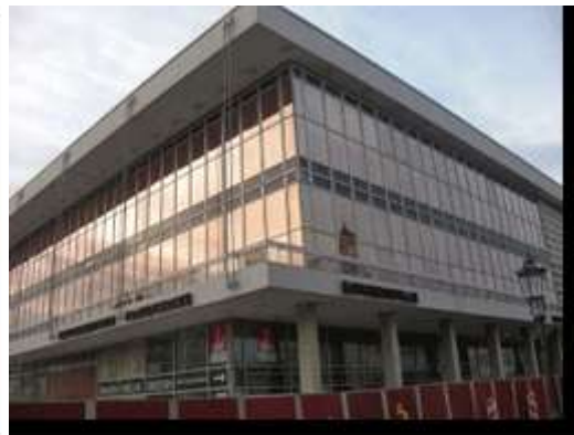
Le Consul au Parlement du Land de Saxe - à droite, Palais de la Culture

- Soirée et réception à l'Opéra de Dresde