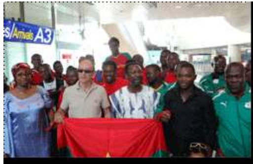
Accueil des Etalons Juniors à l'aéroport Le Consul, le président des Burkinabè de Nice et le Staff de l'équipe de football

31 août 2013. Le Consul a accueilli à l'aéroport l'équipe de football des Etalons Juniors et les a installés à Villeneuve-Loubet où ils se sont entraînés pour les 7ème Jeux de la Francophonie de Nice.