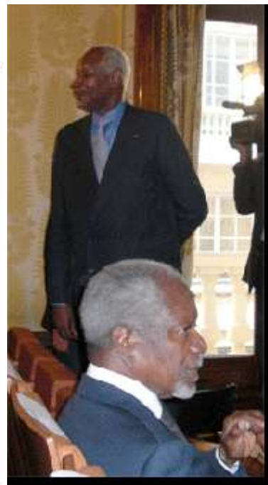
Kofi Annan, Blaise Compaoré, Abdou Diouf