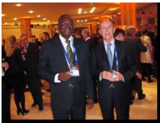
Le Ministre de l'Agriculture burkinabè et le Consul de Nice