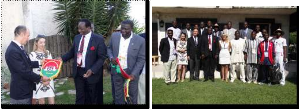
La délégation burkinabè pour les Jeux de la Francophonie, sous la conduite du Ministre des Sports