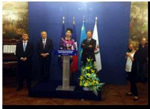
Un groupe de musiques et danses Kazaks et Mme l'adjoint au maire d'Astana