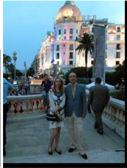
Défilé militaire le 14 juillet à Nice, suivi d'une réception à la Villa Masséna