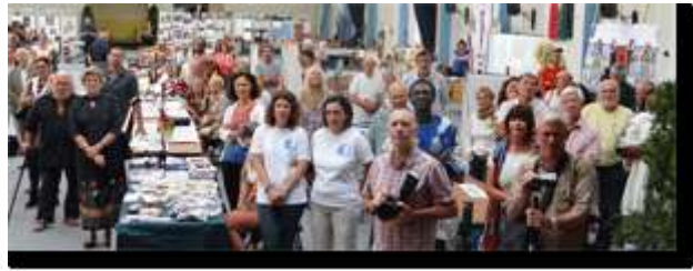
Monsieur le Sénateur-Maire de Grasse, monsieur le Consul de Nice, monsieur le Consul Général et le Consul de Pologne