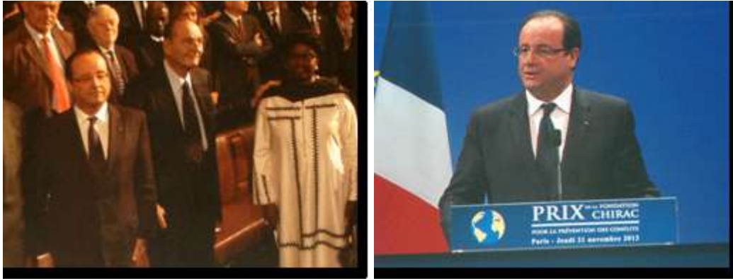
Le Président Hollande et le Président Chirac