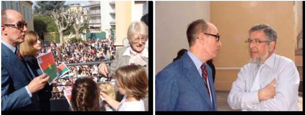
Le Consul remettant les diplômes, et à droite avec le directeur d'établissement