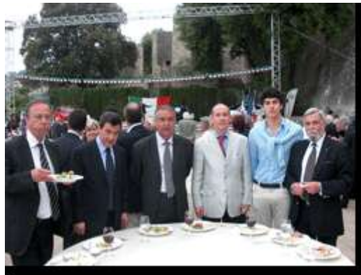
Les Consuls d'Autriche, d'Algérie, de Tunisie, du Burkina Faso et de Roumanie