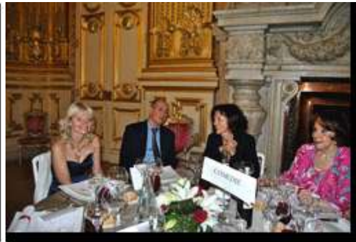
Le Consul et madame au dîner de gala des fêtes consulaires de Lyon