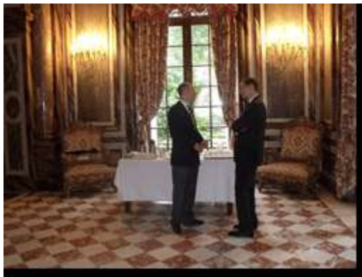
Le Consul avec l'Ambassadeur de Roumanie