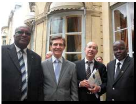
Le Consul en compagnie de S.E Marc Rock Kabore, Président de l'Assemblée Nationale du Burkina Faso