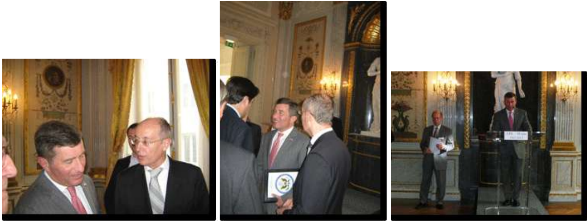
Le Consul en compagnie de l'Ambassadeur des USA Charles Rivkin