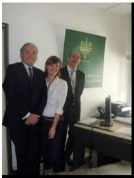
Le Consul de Nice, président de l'UCHF au bureau de l'UCHF de Lyon avec Mr. G. Herrbach Secrétaire Général et Camille, stagiaire