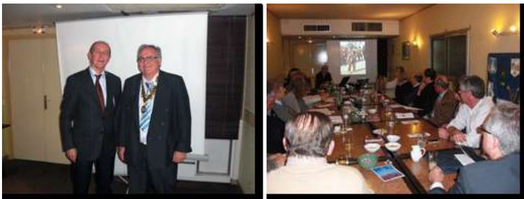
Le Consul avec le Président du Rotary