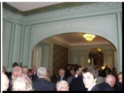
Le Consul avec sa famille et la réception à l'Académie