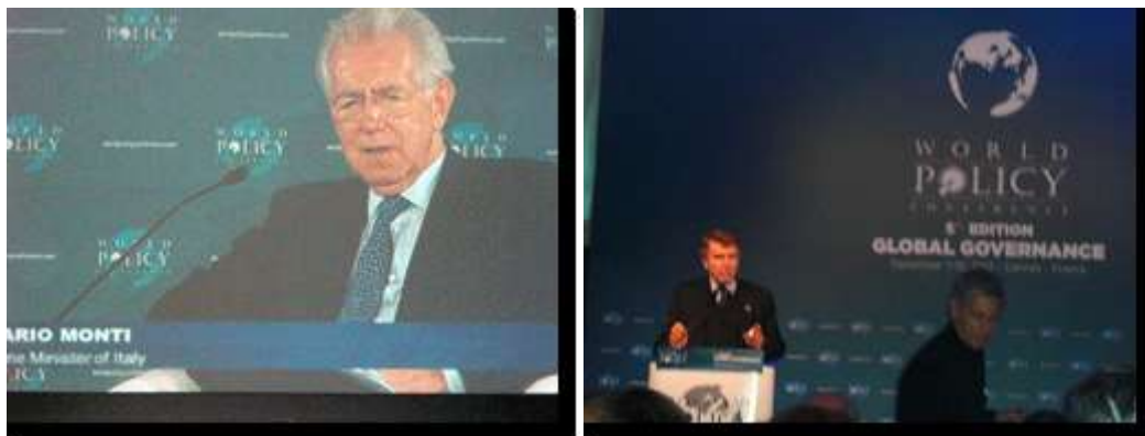
Monsieur Mario Monti, Monsieur Thierry de Montbrial