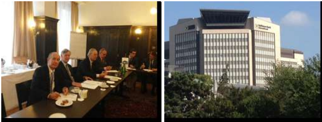
Le Consul à Vienne