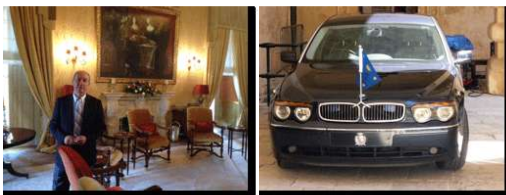
Palais et voiture présidentiels