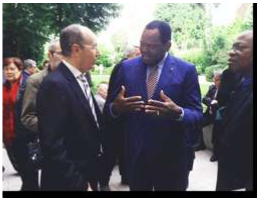
Le Consul et le Ministre Ye