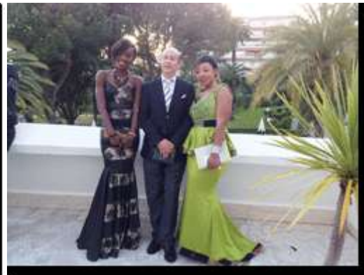
Interview du Consul - à droite en compagnie de deux modèles ivoiriens