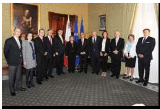
Malte : le FUECH en compagnie de la Présidente de la République de Malte et au Ministère des Affaires Etrangères