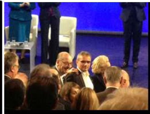
L'ancien Premier Ministre Alain Juppé, l'ancien Président Jacques Chirac