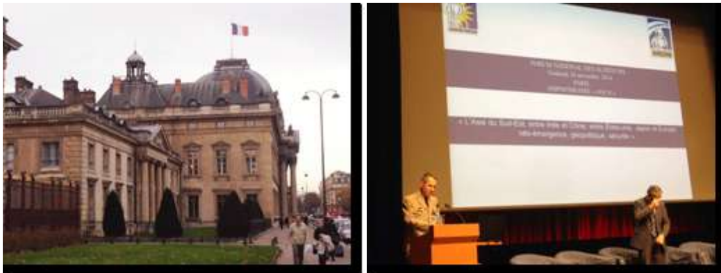
L'Ecole Militaire, le Général de Courrèges d'Ustou