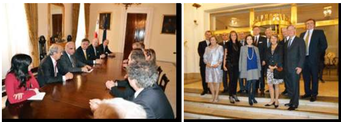
Réunion avec Mr Vella, Ministère des Affaires Etrangères, Hôtel Phoenicia