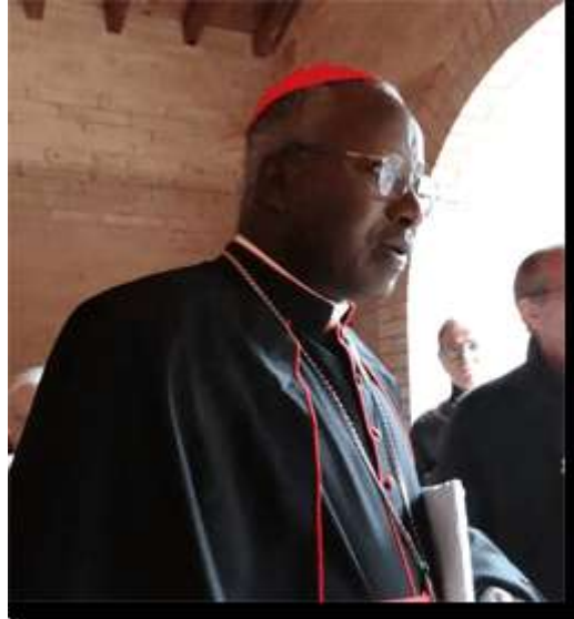
Le Cardinal Philippe Ouedraogo